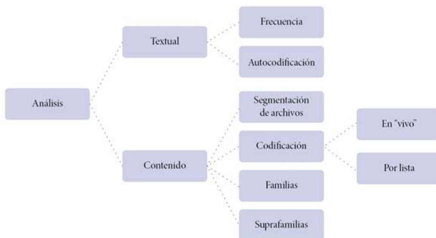
Figura 2. Análisis textual y contenido

En la codificación abierta se generan tantas categorías preliminares, propiedades y dimensiones como son posibles mediante un trabajo de "arriba-abajo" entre diferentes códigos e indicadores. Para construir las grandes categorías en el análisis se crearon "familias", en las que están vinculados tanto los documentos primarios, como los códigos. Estas "familias" permiten la generación de redes semánticas a partir de los códigos utilizados, de manera que se sigue un proceso que construye la teoría emergente acerca de cómo son las escuelas donde los niños no aprenden. La generación de "familias" se realiza mediante operadores booleanos, que nos permiten no sólo vincular documentos y códigos, sino también indicar el tipo de relación que existe entre ellos. De este modo se crean supercódigos y operadores de proximidad, inclusión, solapamiento o distancia.